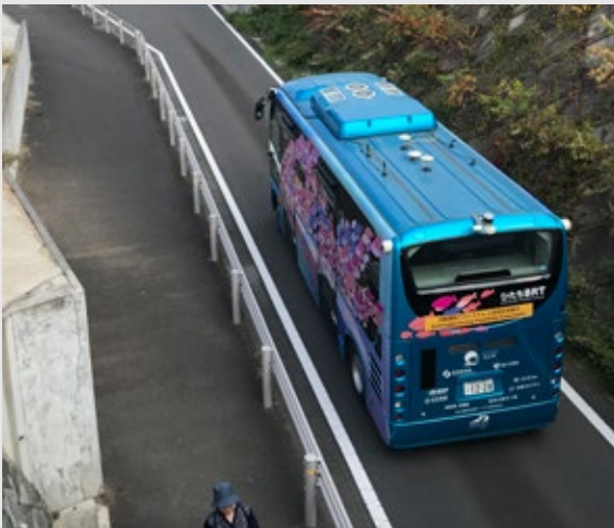
▲ひたち BRT での自動運転実証実験

またサービスの実装では、無人車内における料金収受や緊急時の旅客対応の仕組みをあらたに構築する必要が生じる。長く提供されてきたバスだからこそ、習慣として現場に染みついている多くのルール